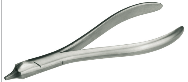
Krampronzange / Universalzange für weichen und harten Draht Universal Pliers for soft and hard wire Länge/ length: 15 cm REF 11889