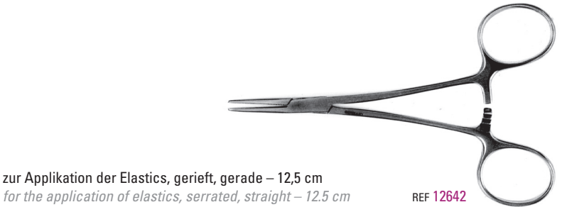
zur Applikation der Elastics, gerieft, gerade – 12,5 cm for the application of elastics, serrated, straight – 12.5 cm REF 12642