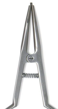
Separierzange zum Einbringen von Gummi-Separierligaturen Separating Forceps for inserting elastic separators REF 11887