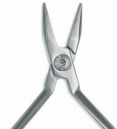
Drahtbiegezange JARABAC Wire Bending Pliers max. Ø 0,7 mm/0.028 inches REF 11883