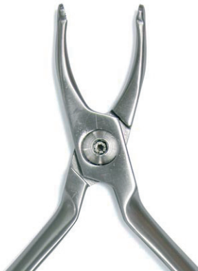
HOW Ligaturenzange HOW Ligature Pliers REF 11881