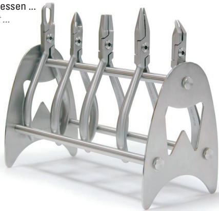
Zangenständer "Premium" / shelf for pliers REF 11890