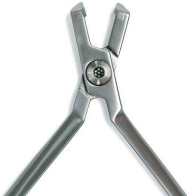
Distalschneider mit Drahtfangvorrichtung Distal End Cutter with wire holding device max. Ø 0.021 – 0.025 inches REF 11880

Aus qualitativ hochwertigem und speziell gefertigtem Edelstahl hergestellt. Matte Oberflächen für einfachste Reinigung und Schutz gegen Korrosion. made of high quality and especially suited stainless steel. Satin finished surfaces for easy cleaning and corrosion protection.