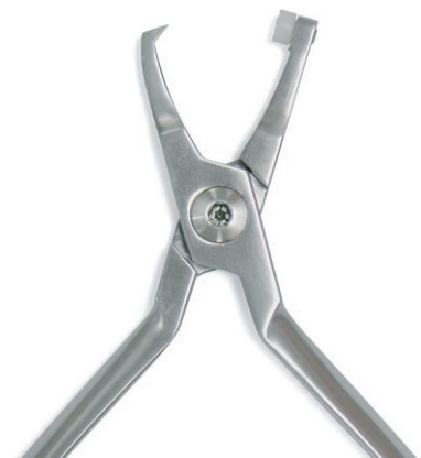
OLIVER Bandabnehmezange Band Removing Pliers REF 11885