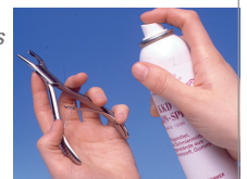
KKD Silikon Spray REF 13286

All joint and hinge instruments should always be kept lubricated and sterilised in open position. So the instruments will work smoothly for years.