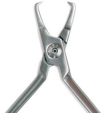
Bracket-Abnehmezange Bracket Removing Pliers REF 11882