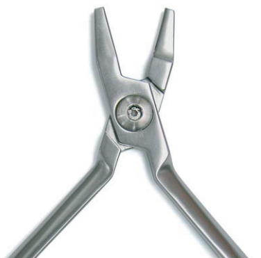
ADERER Dreifingerzange für weichen & harten Draht Three-Jaw-Pliers for soft and hard wire max. Ø 0.028 inches REF 11886