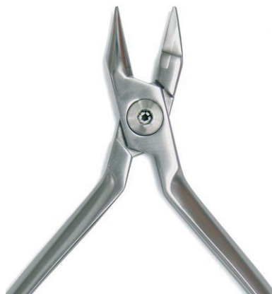
TWEED Schlaufen- und Bogenbiegezange Loop- and Arch Forming Pliers max. Ø 0.021 – 0.025 inches REF 11884