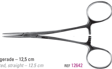
zur Applikation der Elastics, gerieft, gerade – 12,5 cm for the application of elastics, serrated, straight – 12.5 cm REF 12642