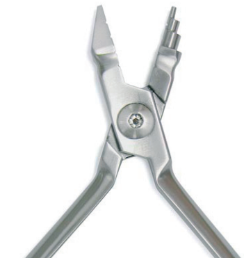
YOUNG Schlaufen- und Bogenbiegezange für weichen & harten Draht Loop + Arch Forming Pliers for soft and hard wire max. Ø 0,7 mm / 0.025 inches Länge/ length 12,5 cm REF 11888